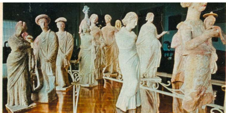
Il joue avec ses statuettes de Tanagra, leur donne des noms, les marie entre elles.